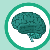
ระบบประสาท