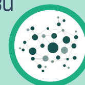
โรคมะเร็ง