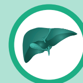
อวัยวะและระบบสำคัญ